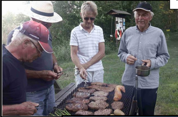
Grillmästarna på vårfesten