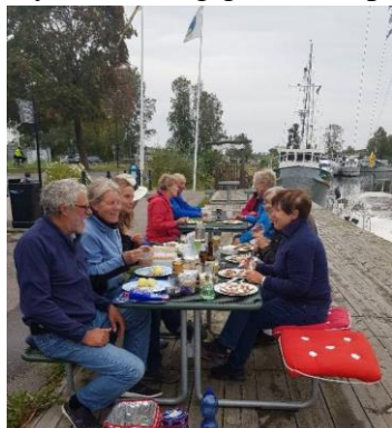
Silllunch på bryggan

Vi åt silllunch tillsammans på bryggan i Torshälla hamn. Torshälla har en mycket trevlig gästhamn på kort gångavstånd till centrum. Sevärt är