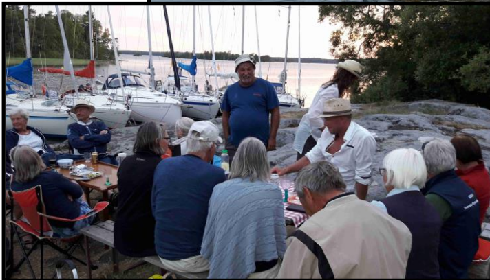
Mingel i våreskaderns sista natthamn - Kyrkviken