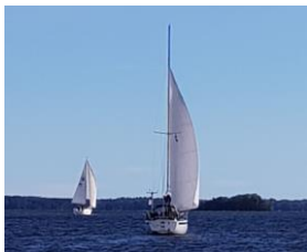
I full fart mot Sundbyholm!

Söndag 23 september: Nu hade vinden lugnat sig betydligt och solen sken. Så vi satte kurs mot