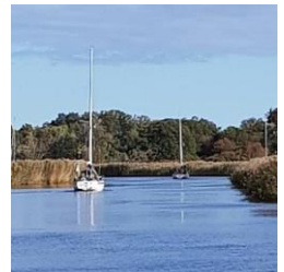
På väg ut i Mälaren via Torshällaån