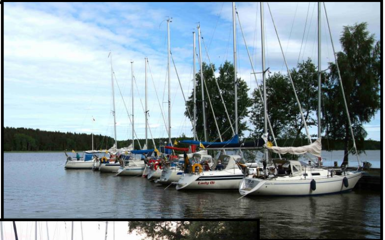
Våreskadern samlad på Askholmen