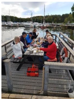
Brygglunch är den bästa lunchen!

Så småningom tog vi en gemensam promenad till Sigurdsristningen. En mycket stor runhäll med en ristning som berättar sagan om Sigurd Fafnesbane. Ristad runt 1000-talet.